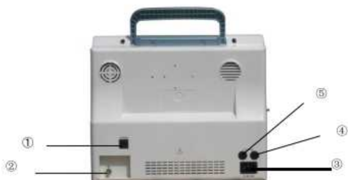
Figura 1-4 (Panel trasero)