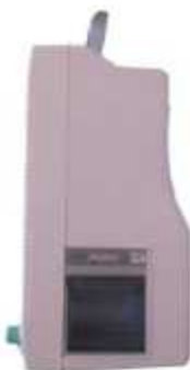
Figura 1-2 (Lado Derecho)

Para la comodidad de operación, los diferentes tipos de interfaces están en diferentes partes del monitor. En el lado derecho está la grabadora (Figura 1-2)