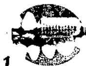
1 Coloque el cepillo a 45° en relación a la encía. Realice movimientos de adelante hacia atrás, cepillando así las caras externas de los dientes.