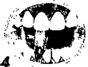
4 En las superficies dentarias internas superiores e inferiores, coloque el cepillo verticalmente. Realice movimientos de arriba hacia abajo.