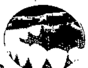
3 Cepille las superficies internas de cada diente, utilizando la técnica del paso 1.