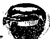
5 Cepille la lengua.