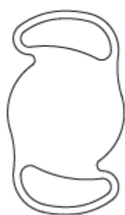
LIO face antérieure IOL Vorderseite IOL front side

Lucidis es una lente intraocular, monobloque, flexible, implantable en el paciente en sustitución del cristalino existente que ha sido oscurecido por la catarata. La lente se inserta en el saco capsular en el interior del ojo mediante intervención quirúrgica tras la extracción de la catarata. Se compone de una zona óptica central (optic) biconvexa de 6,0 mm de diámetro, que posee una estructura esférica en la cara anterior y dos partes exteriores (haptics) para la fijación en el saco capsular. La lente está disponible con un diámetro externo de 10,8 mm y 12,4 mm. Las lentes Lucidis están disponibles para potencias de +5,0 a +30,0 dioptrías. La potencia para la visión lejana (monofocal) figura en la etiqueta en negrita, la profundidad de focalización adicional (monofocal ampliada) se indica mediante «EDOF», que expresa la potencia adicional para la visión cercana e intermedia. Las lentes Lucidis están fabricadas a partir de un material polímero hidrófilo. El polímero absorbe las radiaciones ultravioletas con una transmitancia inferior al 10 % para las longitudes de onda por debajo de 370 nm (ver Fig. 1).