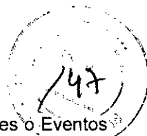
Tabla 2: Proporción de Sujetos Pediátricos de 5 a < 18 Años de Edad con Reacciones Adversas Locales o Eventos Adversos Sistémicos Solicitados dentro de los 7 Días después de la Administración de la Vacuna contra la Influenza de CSL, Independientemente de la Causalidad (Estudios CSLCT-USF-06-29 y CSLCT-FLU-04-05)