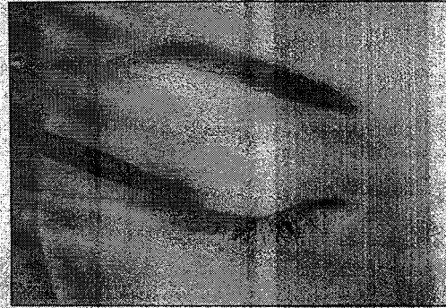
Figura 2. Para posición únicamente

NO APLICAR en su ojo o en el párpado inferior. SOLO usar los aplicadores estériles proporcionados con