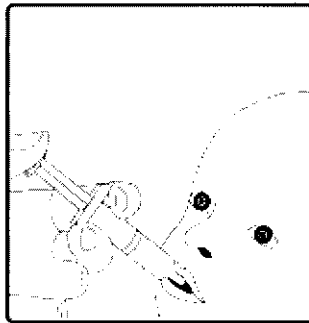
2. Esta vacuna es sólo para administración oral . Sentar al lactante en posición reclinada. Administrar oralmente (es decir, dentro de la boca del lactante, del lado interno de la mejilla) todo el contenido del aplicador ORAL .