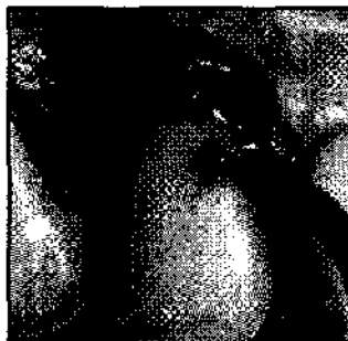
Fig. 3: Dispense cuidadosamente una capa uniforme de klepp Porcelain Etch® en la porcelana preparada.