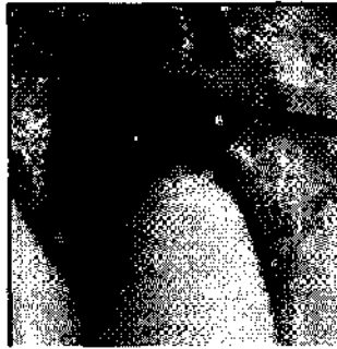
Fig. 2: Se aplica un cordón de burbujas de la barrera neutralizante en los tejidos blandos próximos a la superficie del diente.