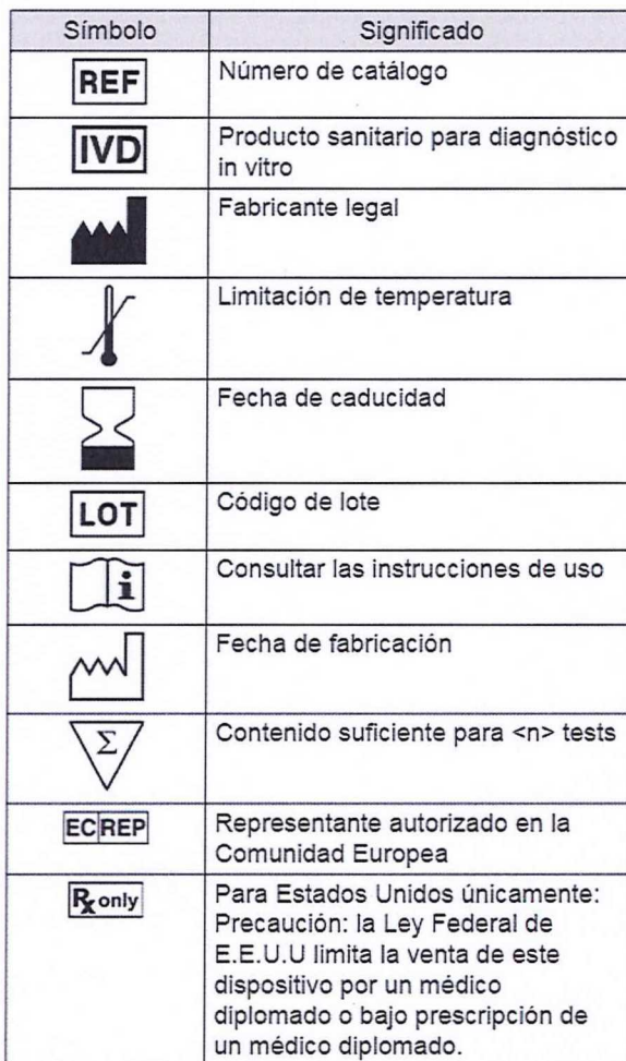
TABLA DE SÍMBOLOS

Las instrucciones de uso se incluyen en la caja o pueden descargarse desde www.biomerieux.com/techlib .