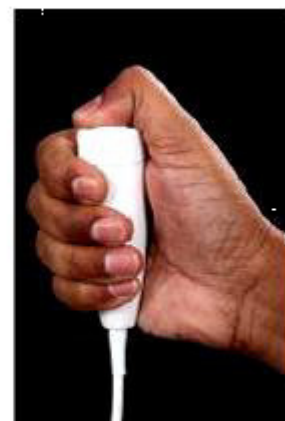
2º nivel "Exposición"