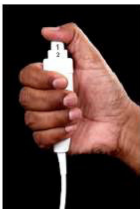
Interruptor manual con exposición de 2 niveles