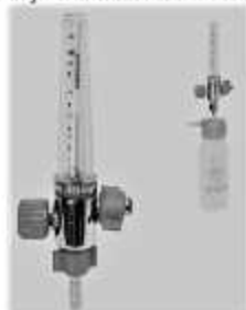
Figura 1: Regulador de flujo o caudalímetro (primer plano) – regulador de flujo con frasco humidificador (segundo plano esquina superior derecha)

⚠ Este regulador está diseñado para suministrar presión de un gas a un dispositivo o aparato médico, NO a un paciente. Si desea suministrar oxígeno (mediante cánula con mascarilla o bigotera) a un paciente deberá hacerlo mediante un regulador de flujo o caudalímetro como el de la Figura 1.